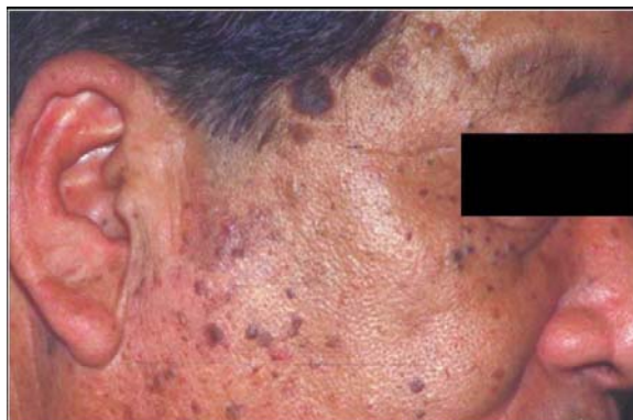
Fig. 6. Cloracné e hiperpigmentación en el rostro de un trabajador japonés de un incinerador.

El tratamiento del cloracné no difiere del tratamiento del acné común. Con el fin de bajar la carga corporal de dioxinas en personas expuestas a estas sustancias químicas se han intentado varios métodos, incluyendo incorporar a la dieta el consumo de aceite mineral (Moser and McLachlan, 1999), carbón activado (Araki, 1974), aceite de salvado de arroz (Iida, 1995), o el sustituto de la grasa, olestra (Geusau et al., 1999, 2002), al igual que la eliminación cutánea mediante la aplicación de petrolatum, (Geusau et al., 2001b), todos ellos con escaso o ningún éxito clínico. Dado que las dioxinas son solubles en lípidos, la lactancia puede reducir su nivel en la mujer que amamanta (Schechter et al., 1996). Lamentablemente, esto lleva a un aumento de la exposición del bebé amamantado