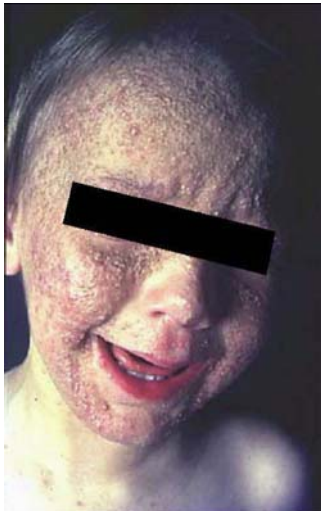
Fig. 3. Cloracné e hiperpigmentación en un niño de Seveso, Italia, expuesto a la 2,3,7,8-TCDD.

exposiciones de hasta 8.000 ppt lípido e incluso algunas con niveles más altos, no desarrollaron cloracné en el incidente de Seveso. Fueros predominantemente los niños quienes lo desarrollaron. Si bien el cloracné perdura a veces durante años, e incluso décadas en algunas cohortes, en los niños de Seveso los casos se resolvieron por lo general dentro del año. En otra población, Coenraads et al. (1999) se observó que el cloracné estaba presente en los siete operarios chinos de la industria química que tuvieron niveles EQT de lípidos sanguíneos superiores a 1000 ppt luego de trabajar en la producción de los biocidas pentaclorofenol y hexaclorociclohexano ( Coenraads et al., 1999 ).