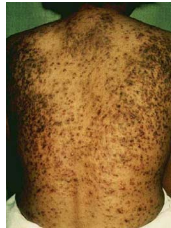
Fig. 4. Cloracné en la espalda de un paciente Yusho.